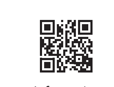
Information in English