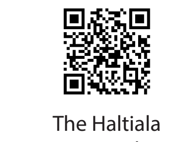
The Haltiala recreational area