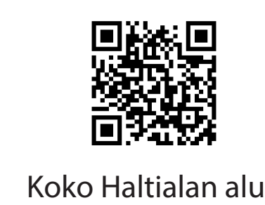
Koko Haltialan alue